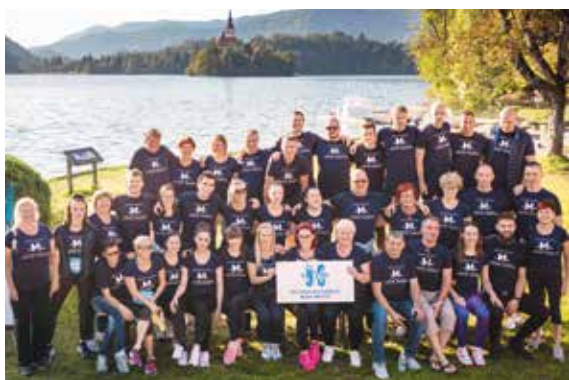
Sledili sta ji ekipa Splošne bolnišnice Novo mesto na drugem mestu