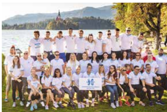
... in ekipa Ortopedske bolnišnice Valdoltra na tretjem mestu.