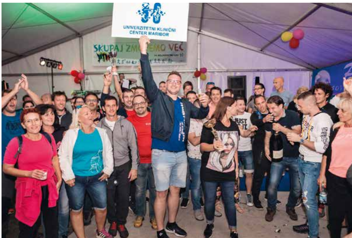
Univerzitetni klinični center Maribor