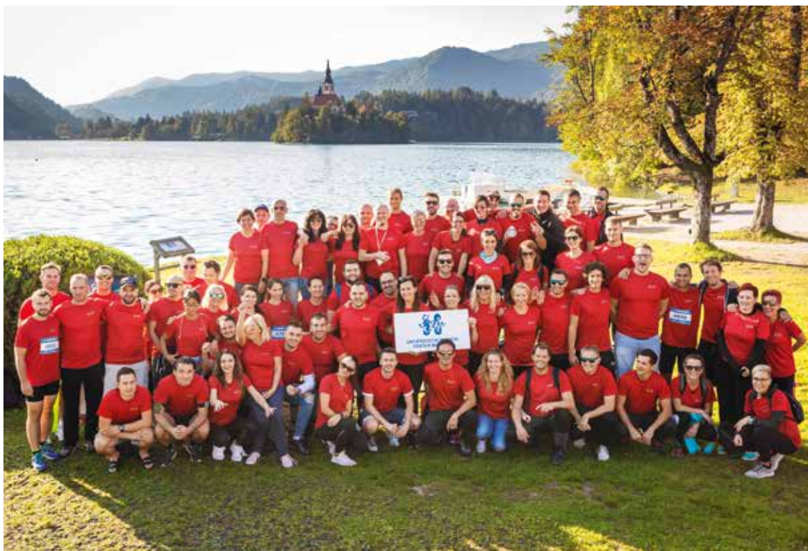
Na letošnjih igrah slovenskih bolnišnic je zmagovalno 1. mesto v skupnem seštevku dosegla ekipa UKC Maribor